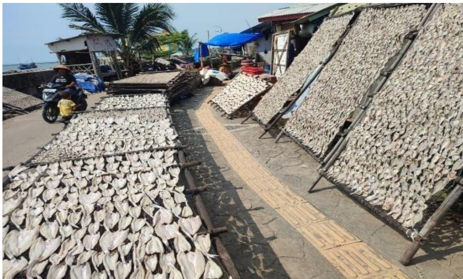
Gambar 1. Proses Penjemuran Ikan Asin

Wilayah pesisir memiliki peran strategis dalam struktur perekonomian nasional karena sumber daya kelautan dan perikanan yang dimilikinya berkontribusi terhadap pembangunan ekonomi lokal dan nasional (Kementerian Kelautan dan Perikanan, 2020). Sektor kelautan tidak hanya menyediakan bahan baku bagi industri pengolahan, tetapi juga membuka kesempatan bagi pengembangan usaha mikro, kecil, dan menengah (UMKM) berbasis pengolahan hasil laut (Badan Pusat Statistik, 2024). Berdasarkan hasil observasi lapangan, UMKM perikanan umumnya menghadapi keterbatasan pada aspek pengolahan, pemasaran, serta manajemen usaha, sehingga nilai tambah produk yang dihasilkan belum optimal dan berdampak pada rendahnya kesejahteraan masyarakat pesisir (Sari & Nugroho, 2021).