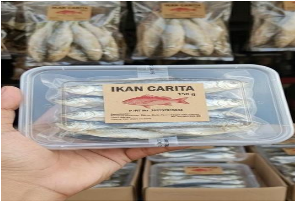
Gambar 4. Ikan Asin dalam Kemasan Kotak Siap Jual

Meskipun penerapan pemasaran digital masih dilakukan secara sederhana dan bertahap, kegiatan ini menjadi langkah awal dalam mengubah pola pemasaran yang sebelumnya bersifat konvensional. Pelaku UMKM mulai mencoba mempromosikan produk melalui pesan digital dan media sosial, sehingga membuka peluang untuk menjangkau konsumen di luar wilayah Desa Carita. Perubahan ini menunjukkan adanya peningkatan kesadaran pelaku usaha terhadap pentingnya adaptasi terhadap perkembangan teknologi dalam menjalankan usaha.