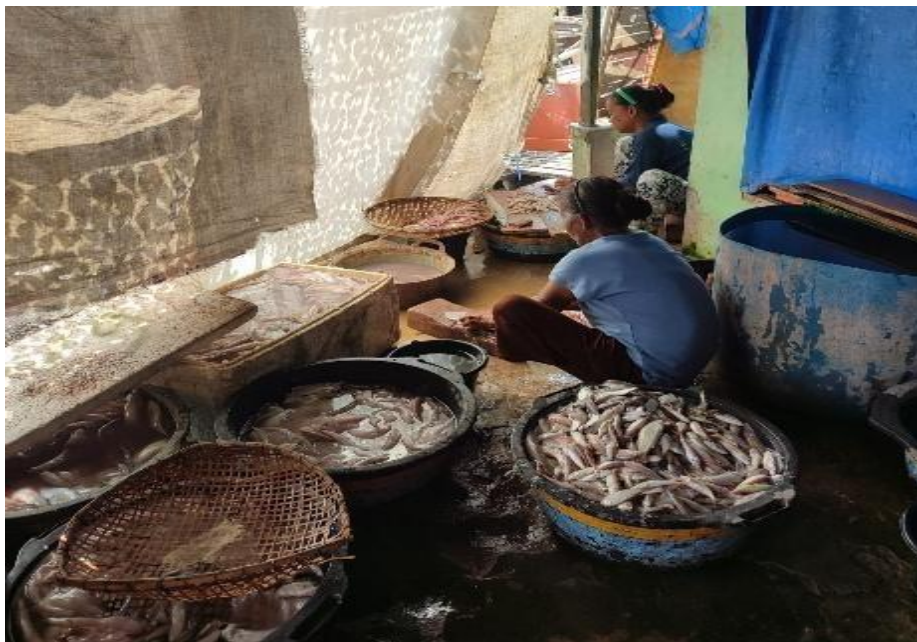
Gambar 2. Proses Pengolahan Ikan Asin

Selain pemasaran, aspek kemasan dan branding juga berperan penting dalam meningkatkan nilai jual produk pangan olahan. Kemasan yang higienis dan informatif mampu meningkatkan persepsi kualitas serta kepercayaan konsumen terhadap produk UMKM. Studi terbaru menunjukkan bahwa inovasi kemasan berpengaruh signifikan terhadap minat beli dan loyalitas konsumen terhadap produk UMKM pangan Yuliana & Pratama, (2023).