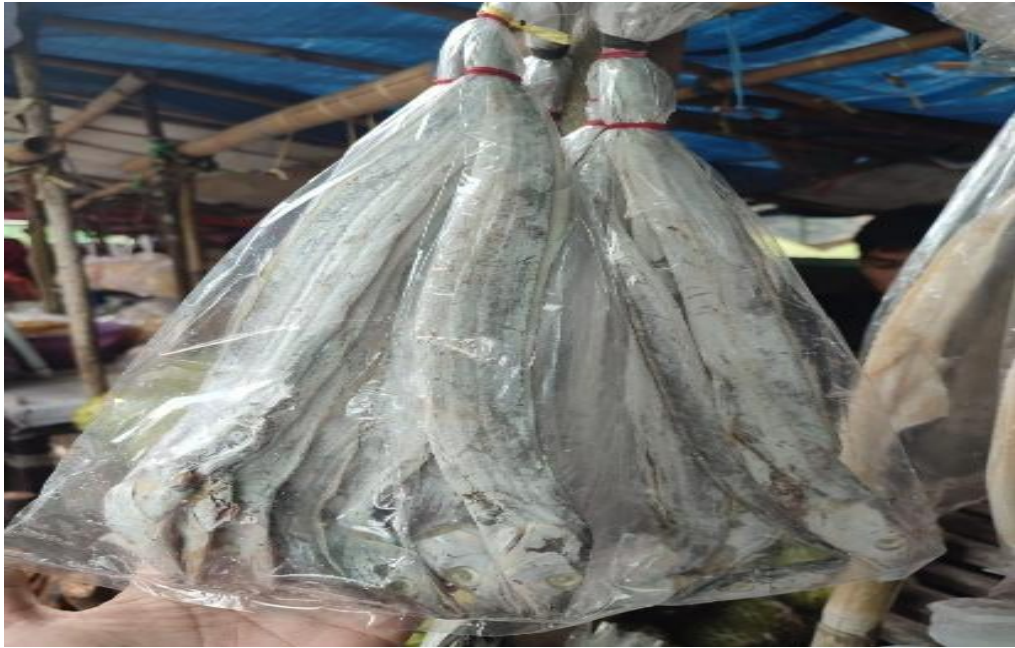
Gambar 3. Ikan Asin dalam Kemasan Plastik Siap Jual